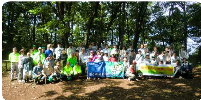
NEC・東芝の参加者の皆さん

午後は、浅間山の自然観察がてら、住宅街の中に残された貴重な自然を保護している活動状況を見学してもらいました。参加者の方々からは「身近にこれほどの豊かな自然が残っていたとは思わなかった」との感想がありました。