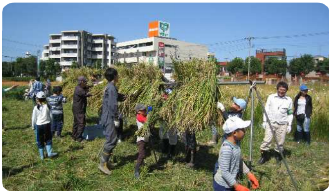
稲のハサ掛けを行う子どもたち

今年は、田んぼにクログワイと呼ばれる雑草が繁殖し、それに加えてスズメに食べられてしまい、収穫量が気になるところです。