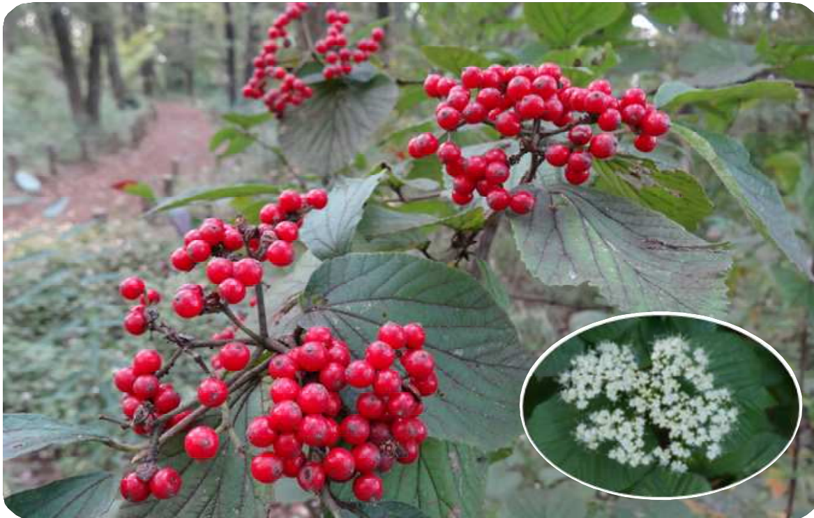
浅間山のガマズミ