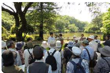
昨年の見学会風景

この研究所の敷地では、武蔵野の自然が保護されており、野川の源流の一つがあるほか、40種類を超える野鳥が生息し、約120種類2万7千本の樹木を見ることができます。