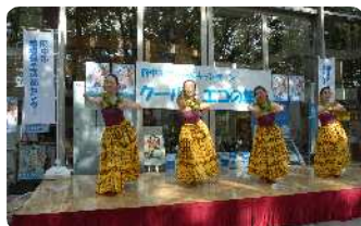
フラダンスショー

午後3時半からの「エコハピステージ」では「打ち水」に先立ち、目で“涼”を感じていただくために、フラダンスショー、エコガールズライブ、浴衣ステージを実施しました。