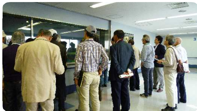
説明を熱心に聞く受講生