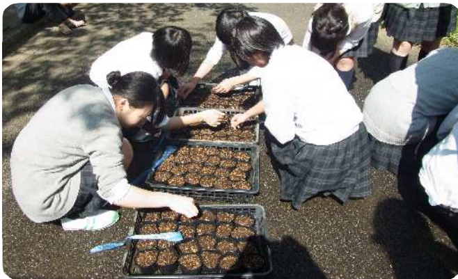
センター事業のゴーヤ及びヘチマを育成する生徒たち

地域に向かって積極的に飛び出し、いろいろな団体との連携を深め、環境情報を相互発信できるような学校を模索しています。