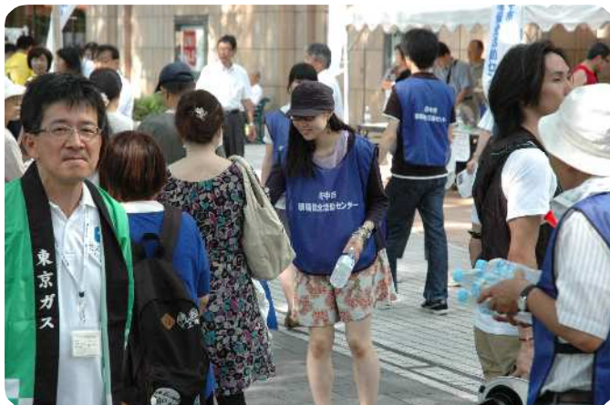
イベントで飲料水の配布をするサポーター