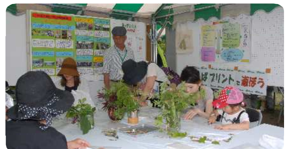
参加者による体験