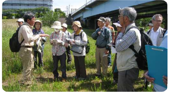
講師の話熱心に聞く参加者たち