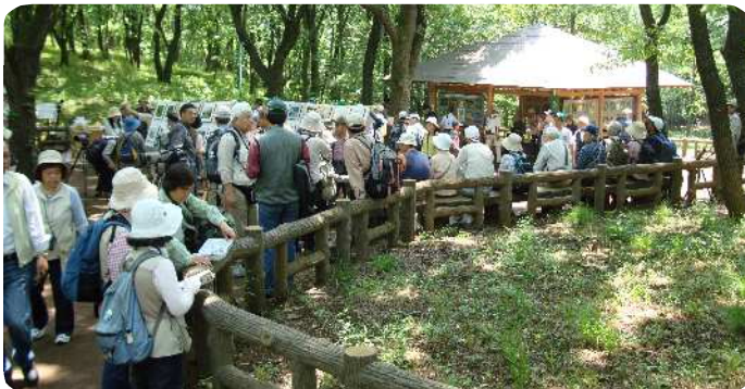
浅間山自然保護会による園内案内