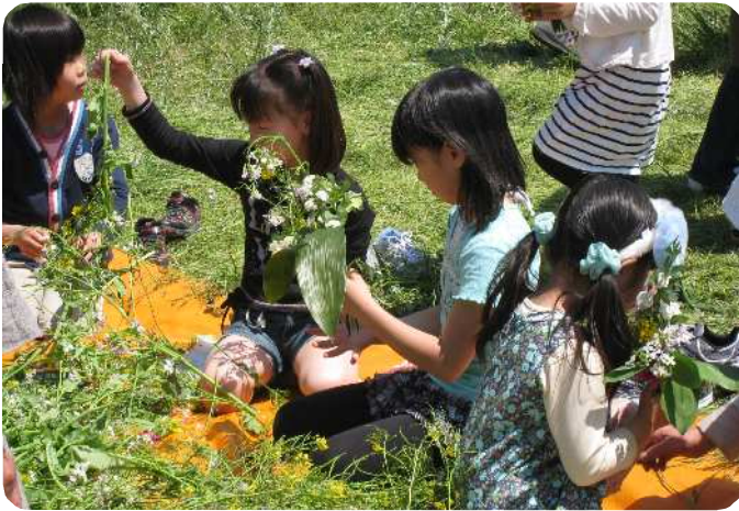
花かざり遊びをする子どもたち