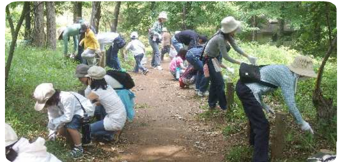
浅間山公園での清掃活動