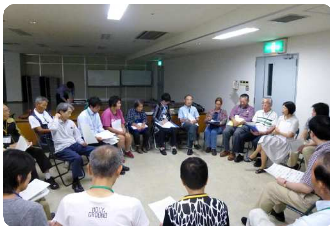
受講生の討論風景