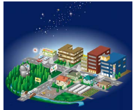
図：環境省 光害啓発パンフレット

「光害」は照明器具から出る光が、目的外の方向に漏れたり、周辺環境にそぐわない明るさや色であったり、必要のない時間帯にまでつけっぱなしであったりすることで起こります。おもな「光害」の例は次のとおりです。